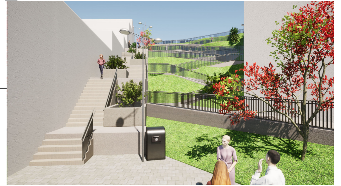
B CONECTIVIDAD VERTICAL CALLE 2